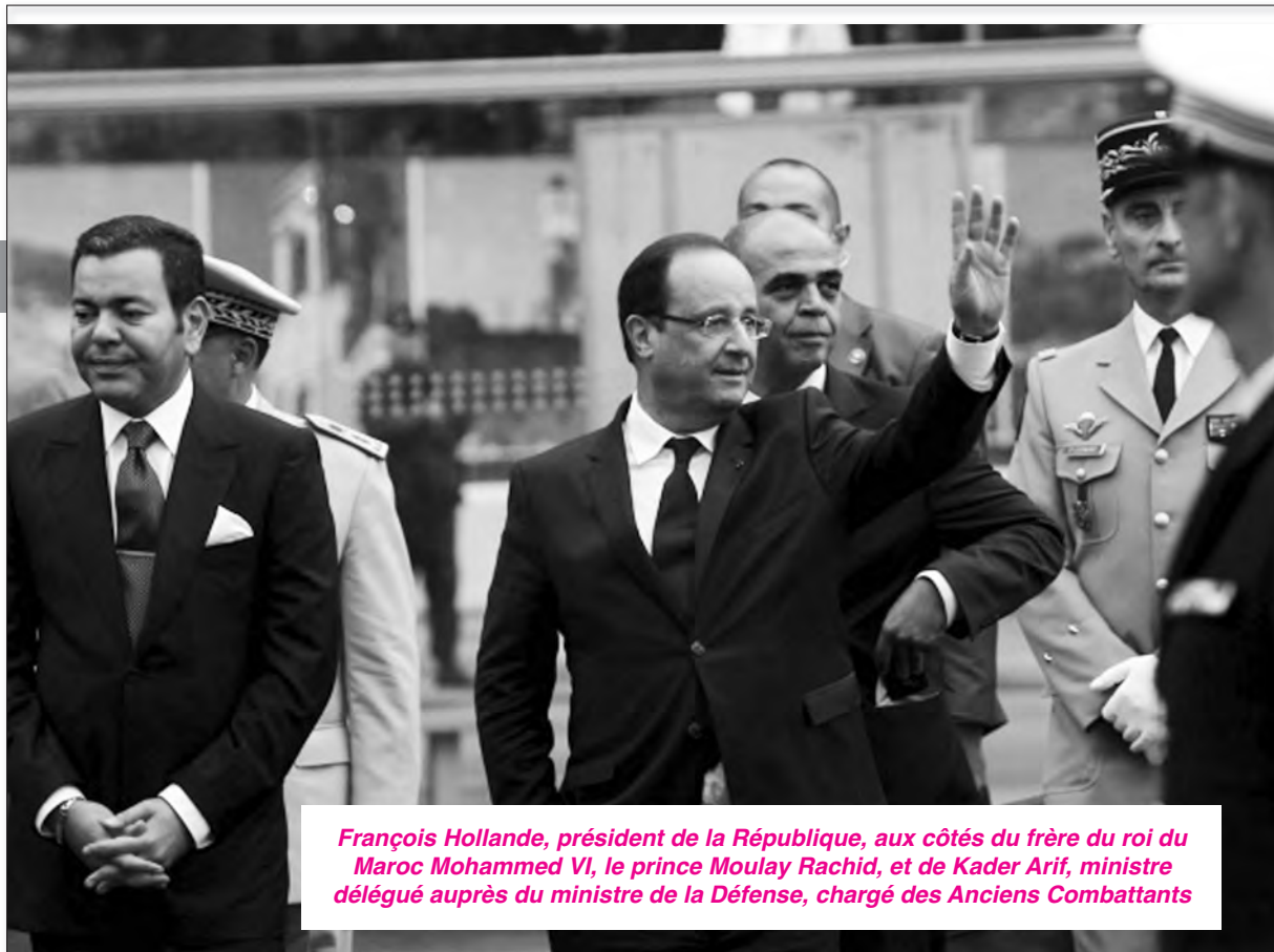
François Hollande, président de la République, aux côtés du frère du roi du Maroc Mohammed VI, le prince Moulay Rachid, et de Kader Arif, ministre délégué auprès du ministre de la Défense, chargé des Anciens Combattants

Et d'ajouter : «Ici, il y a 20 ans, sur cette place, François Mitterrand disait : «Parce que la France est une grande Nation, il faut qu'en son sein la Corse soit elle-même». Et bien à nous encore aujourd'hui, de faire que la Corse soit elle-même pour être pleinement dans la République. Le statut particulier tire les leçons de la spécificité de la Corse. J'ai donc répondu favorablement à la proposition de dialogue qui a été avancée par l'Assemblée de Corse pour qu'il puisse y avoir une concertation entre les élus de l'île et l'État. Ce débat est utile, il est nécessaire parce que ensemble nous avons à répondre aux défis : L'emploi, le développement économique, la protection de l'environnement, et parce que l'Etat doit aussi assurer ici la sécurité, la sûreté. La lutte contre les violences, c'est un combat que nous avons engagé et je vous l'assure, il ne faiblira pas. Nous y mettrons tous les moyens, nous obtenons déjà des résultats».