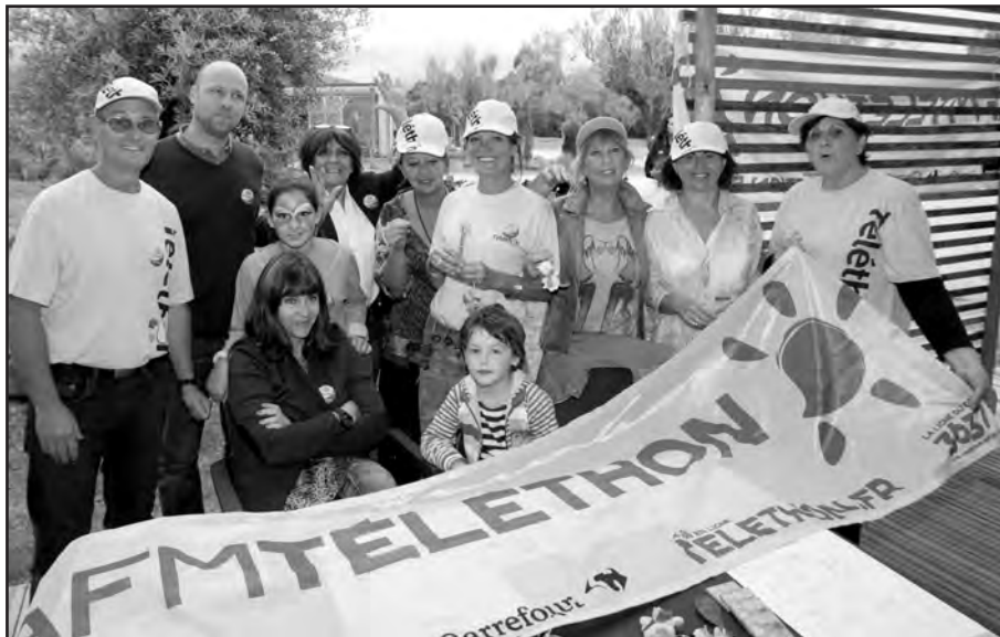
Bénévoles en action

Depuis sa création en 1987, le téléthon est le plus bel exemple de combat citoyen. C'est la possibilité pour chacun de faire bouger les choses, de devenir acteur de la recherche, de s'unir autour des malades et de leurs familles et de leur témoigner solidarité et soutien. Le lancement officiel de la nouvelle campagne s'est fait il y a quelques jours à Ajaccio et voilà que déjà les comités de secteur se mettent en action et trouvent des partenaires efficaces.