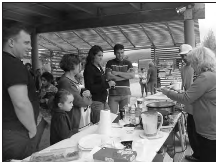
Crêpes, gâteaux, boissons étaient à la vente